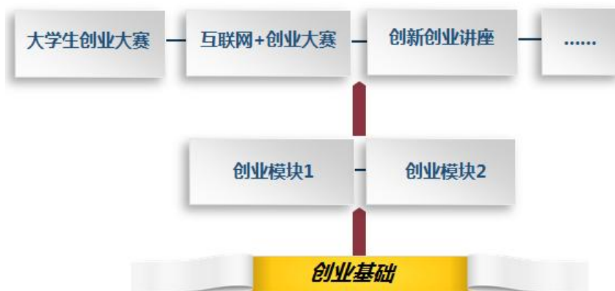
图3 创新创业课程体系建设思路