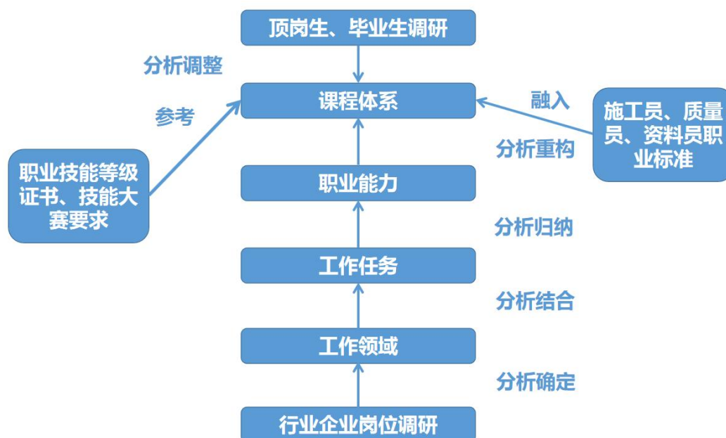
图2 课程体系构建过程图

经过行业、企业调研，得到本专业学生的工作岗位，围绕主要岗位，分析出其对应的典型工作任务，参考相关职业岗位标准、职业技能等级证书、技能大赛要求，确定职业能力，重构课程体系，专业课程由浅入深，市政工程技术专业与市政工程行业的施工员、质量员、资料员岗位对接，专业课程内容与职业标准对接，学习任务与生产任务对接，学历证书与职业资格证书对接，职业教育与终身学习对接，具体如图 2 所示。